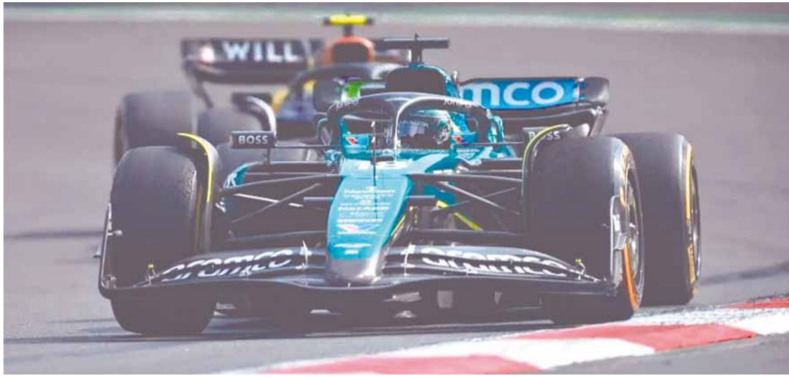
Franco Colapinto, arriba de su auto de Fórmula 1

Luego de la gran carrera realizada en México