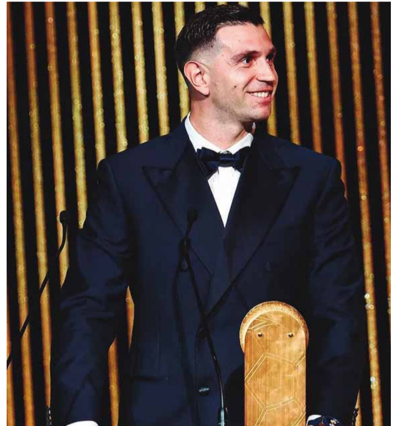
Martínez, otra vez ganador

El arquero de la Selección argentina y del Aston Villa Emiliano “Dibu” Martínez, fue galardonado con el Premio Yashin como el mejor arquero del mundo, en la ceremonia del Balón de Oro. Al recibir el trofeo de manos de su compatriota y compañero de Selección, Lautaro Martínez, el arquero le agradeció al “Toro” por su gol en la final y destacó que “lo individual siempre viene después de lo grupal”.