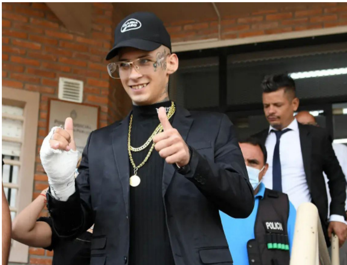
Condena. Sólo fue sentenciado por las amenazas

Por amenazar y privar ilegítimamente de su libertad a una mujer y un hombre