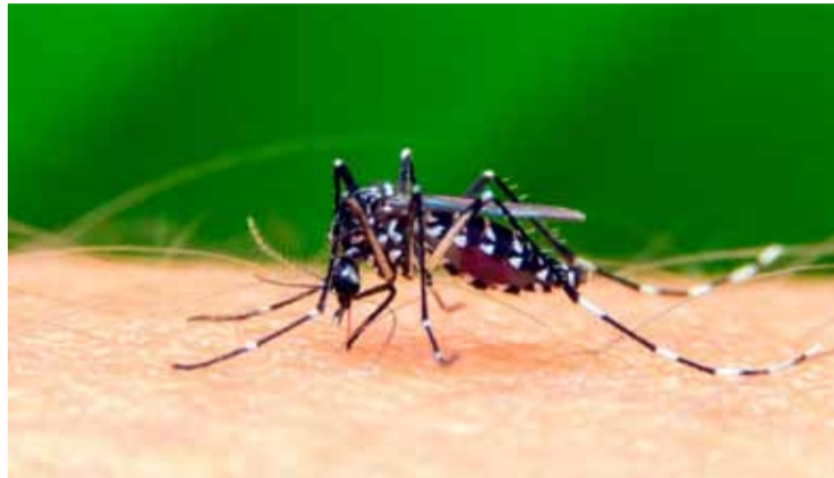
Contagio. Los Aedes aegypti son vectores de los virus del dengue

En tanto, sobre los casos probables señala que corresponden a las regiones sanitarias I (1), V