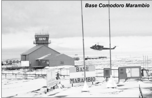
Base Comodoro Marambio