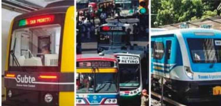
Los subtes, trenes, camiones, transporte aéreo y marítimo paran el miércoles 30; los colectivos, el jueves 31

El paro de este martes de ATE arrancará a las 12 del mediodía y será por 36 horas, ya que se plegará luego al de 24 horas del transporte. Incluirá una marcha a las puertas del Ministerio de Desregulación y Transformación