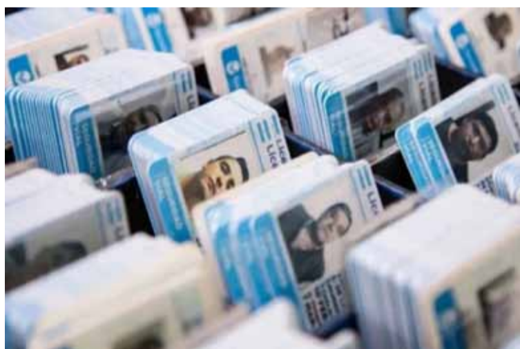
Trámite. Algunos sólo podrán renovar a través de la web

si la persona está psicofísicamente bien, que tenga buena visión y su audición sea la adecuada para estar al comando de un vehículo. En este punto, el funcionario adelantó que permitirán que los aspirantes envíen el certificado correspondiente descartando el trámite presencial.