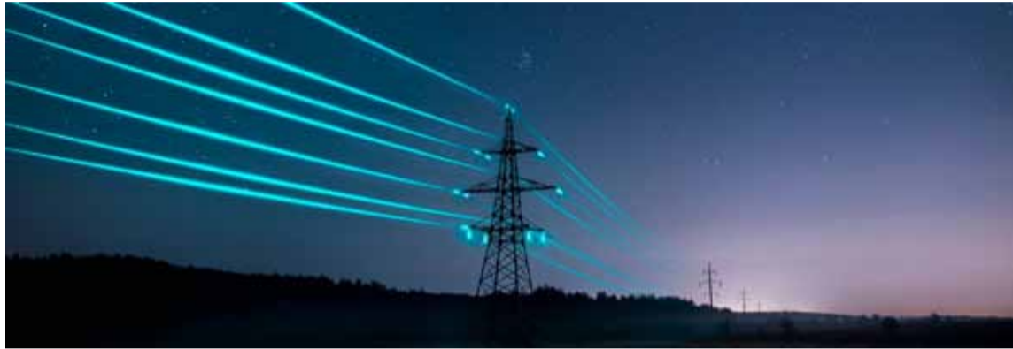
El plan comenzará a partir del 15 de diciembre y tendrá una duración de dos meses

Lanza un plan energético ante cortes en el verano