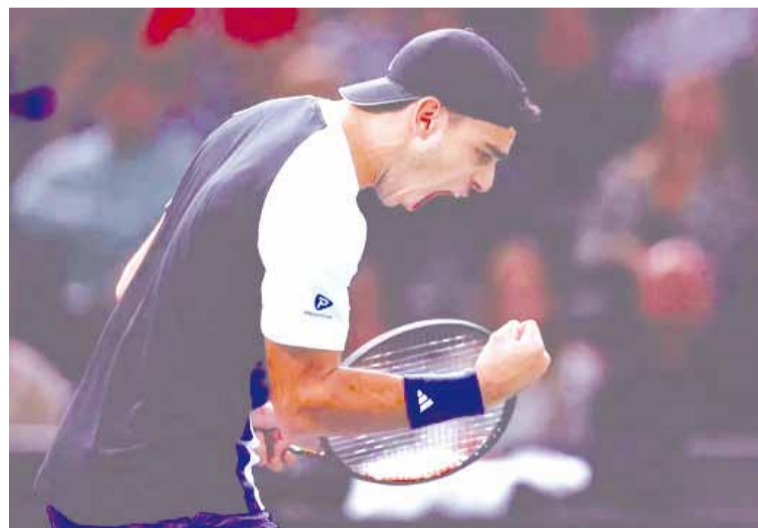
Cerúndolo obtuvo un buen triunfo

este lunes será Sebastián Báez, que debutará en el torneo ante el español Alejandro Davidovich Fokina.