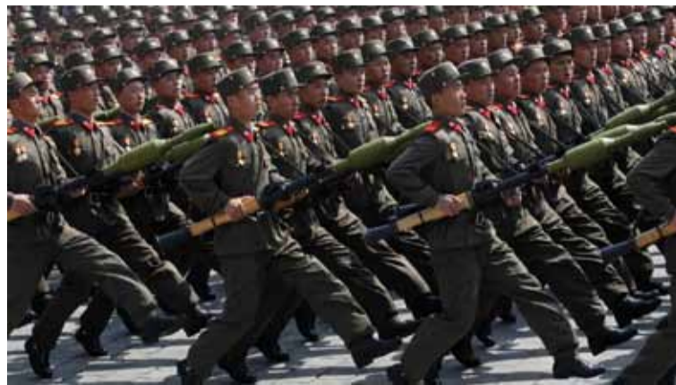
Preocupación. Por presencia de norcoreanos en Ucrania

La OTAN confirmó este lunes que tropas norcoreanas fueron enviadas para colaborar con Rusia en su guerra con Ucrania.