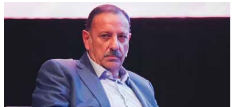
Quintela mantiene su postura

El candidato a presidente del Partido Justicialista (PJ), Ricardo Quintela, reveló que acudirá a la justicia luego de que la Junta Electoral del espacio no oficializara su lista, al sostener que "los partidos se ganan en la cancha, no en el escritorio".