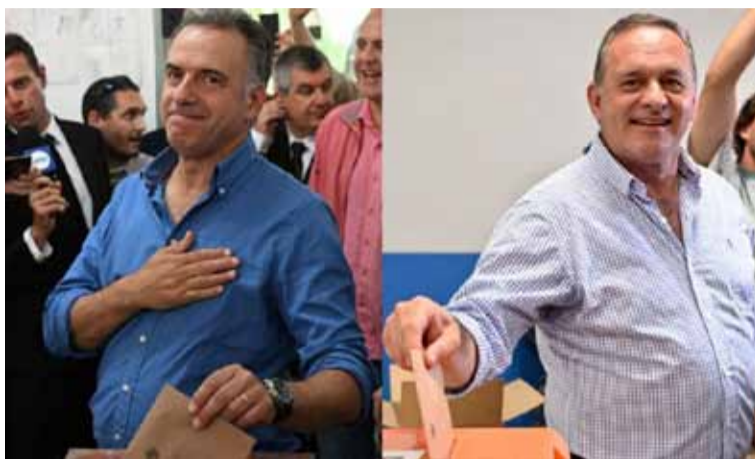
Al balotaje. Irán Yamandú Orsi y Álvaro Delgado

de Historia, actividad que ejerció en liceos públicos secundarios del interior de Uruguay hasta 2005, cuando asumió como secretario general de la Intendencia de Canelones, el departamento uruguayo más poblado después de Montevideo. Desde 2015 hasta marzo de este año (con una reelección en 2019) fue intendente del mismo departamento, que limita con la capital y en el cual pasó los primeros cinco años de su vida en una zona rural, antes de que sus padres se mudaran a la ciudad de Canelones para trabajar y vivir en un almacén.