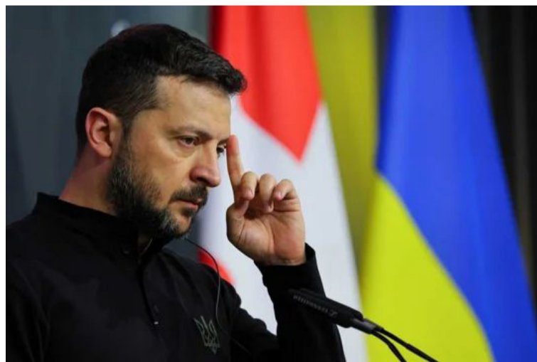
Presidente ucraniano. Volodymyr Zelensky

El presidente ucraniano, Volodymyr Zelensky, propuso este lunes extender la actual ley marcial del país hasta el 7 de febrero de 2025.