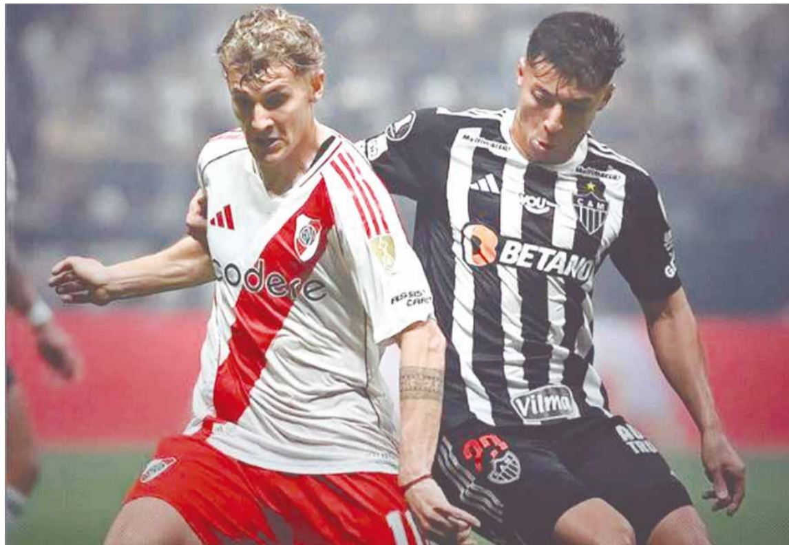
El equipo argentino necesita golear al brasileño

El "Millonario" cayó 3-0 en Brasil y deberá hacer un partido perfecto si quiere llegar a la definición continental