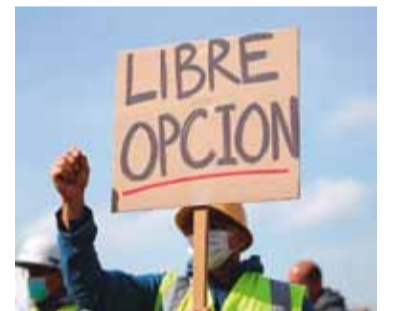
El trabajador podrá elegir su obra social

Libre elección de obra social: El Decreto N° 504/1998,