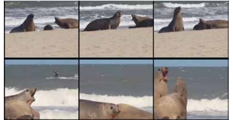
Lobos. En el video difundido por Fundación Ecológica Pinamar

En los últimos días, por primera vez, pudo captarse el nacimiento de un elefante marino en la costa bonaerense, un evento inusual en la zona ya que estos animales cumplen su ciclo reproductivo en la provincia de Chubut, donde se registra la única colonia continental del mundo de la especie.